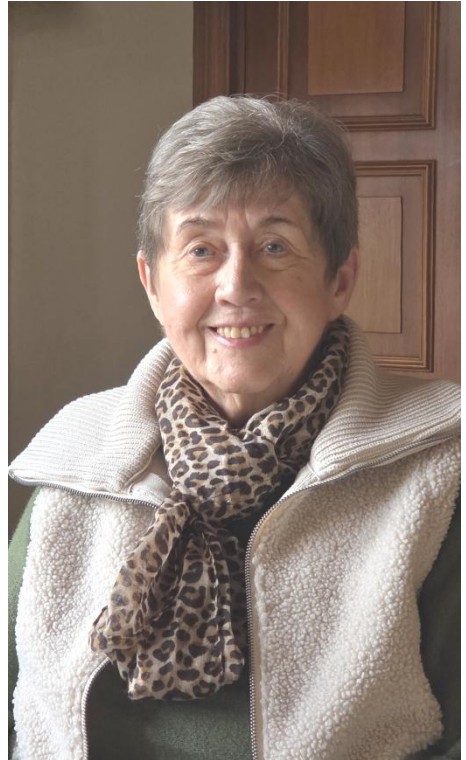
Text und Foto: M. Wapelhorst

Wünschen wir ihr (und unserer Kirchengemeinde), dass sie sich noch sehr lange aktiv einbringen kann und wird.